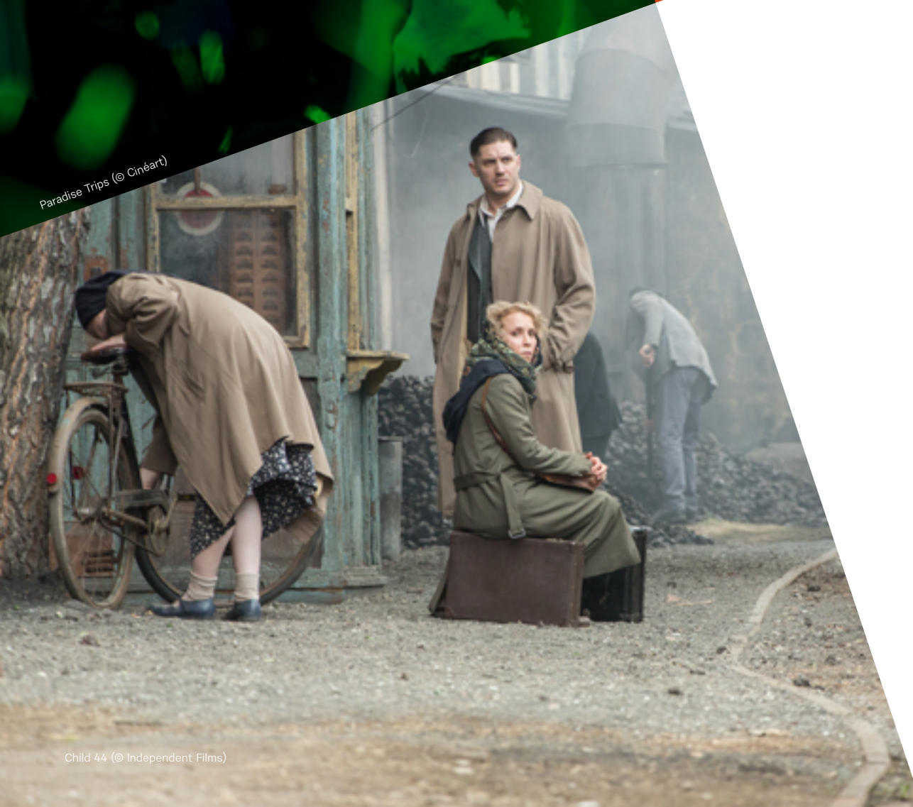
Child 44