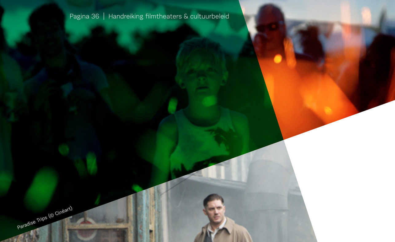
Paradise Trips