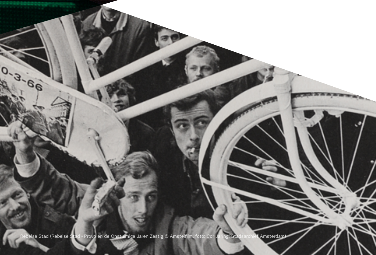
Rebelse Stad (Rebelse Stad - Provo en de Onstuimige Jaren Zestig)