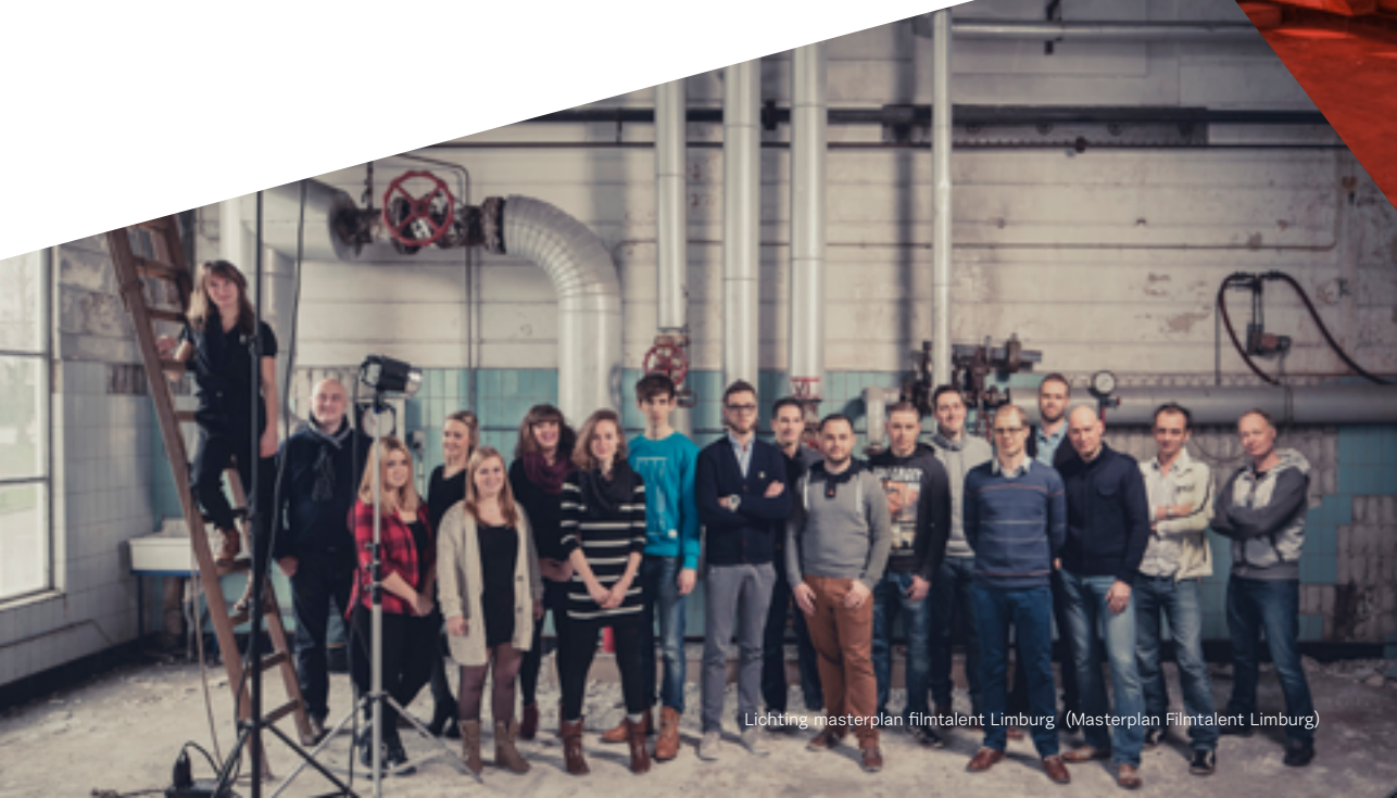
Lichting masterplan filmtalent Limburg (Masterplan Filmtalent Limburg)

Deprez besluit: 'De filmwereld verandert snel. We moeten, samen met de gemeente, blijven nadenken over onze rol daarin.'