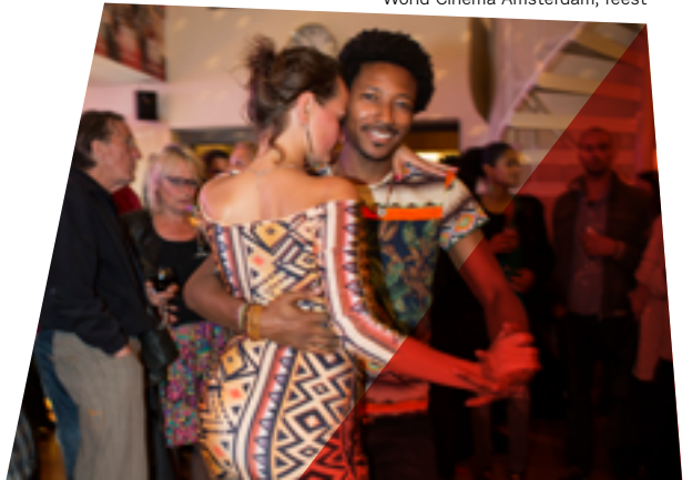
World Cinema Amsterdam, feest

Het wereldcinemafestival met uitsluitend bijzondere films van jonge, getalenteerde filmmakers uit Latijns-Amerika, Azië en Afrika. Het gaat hierbij om delen van de wereld waar prachtige films worden gemaakt die niet vaak te zien zijn in de Nederlandse bioscopen. Het festival wordt elke zomer georganiseerd en duurt tien dagen. Het kent een competitie-programma, een themaprogramma en een gratis toegankelijk Open Air -filmprogramma op meerdere locaties in de stad.